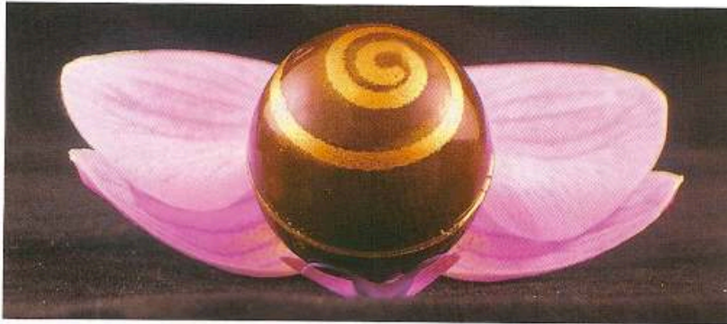
... traumhafte Pralines aus hauseigener Schokolade – deutschlandweit einzigartig!

Creme, Kirschwasser) sowie, ganz aktuell, locker-leichte Krapfen mit selbst gemachter Marmelade. Das siebenköpfige Team hat samt und sonders in Frankreich gelernt und arbeitet mit viel Liebe zum Detail. Grund genug z. B. für das Schauspielerpaar Anna Loos und Jan Josef Liefers, hier herrlich Süßes für ihre Hochzeit fertigen zu lassen.